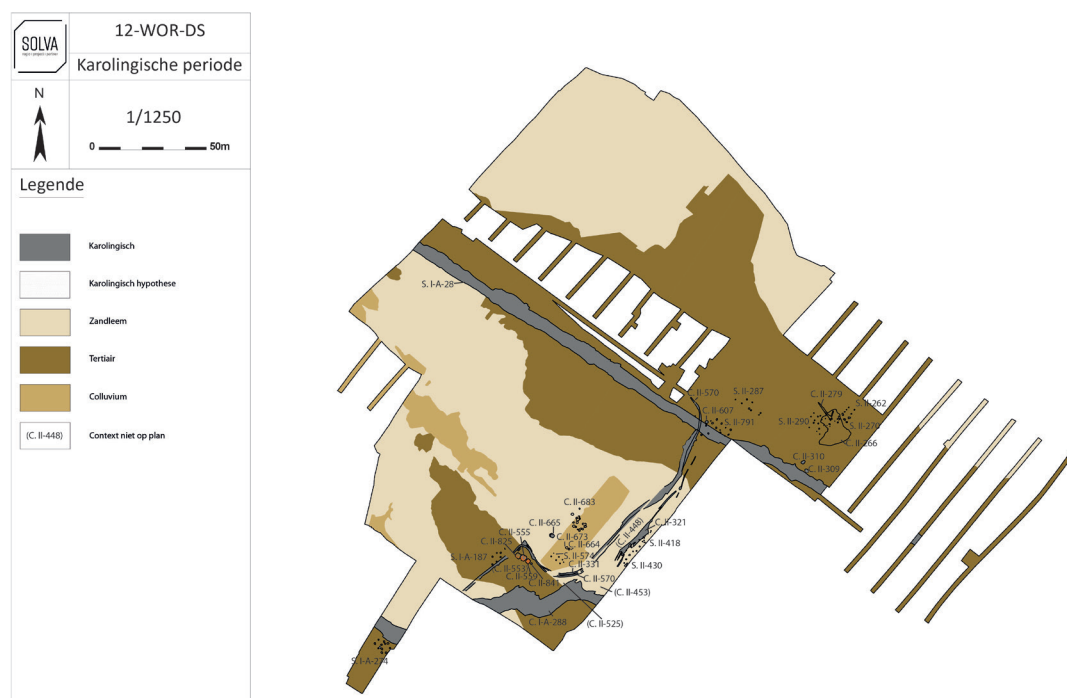
Fig. 2: Vereenvoudigde plattegrond van de Karolingische sporen op de site Wortegem Diepestraat.

Wat betreft de gebouwen kan men er, naar analogie met andere sites in de ruime regio, van uitgaan dat het wellicht hoofdgebouwen zijn zonder een stalgedeelte. Ze zijn nagenoeg allemaal opgebouwd rond een kern van zes