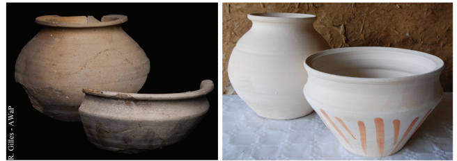
Fig. 3. Céramique archéologique (à gauche) et reproductions par V. Durey (à droite).

Le résultat de la cuisson est homogène (fig. 3); les pots sont bien cuits et sonnants. Les contacts entre les récipients, même décorés de peinture, ne laissent pas de trace. L'oxydation de la barbotine donne des tons orangés identiques aux couleurs originales ; les glaçures sont vitrifiées mais de qualité différente en fonction de leur composition. Sur les 63 récipients enfournés, 10 montrent un léger éclat sur la lèvre, 6 sont fissurés, un est légèrement déformé et un s'est brisé.