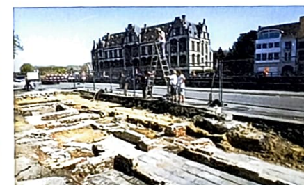
Ook worden overzichtsfoto's genomen van structuren, zoals muren en vloeren