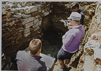
De archeologen bestuderen en registreren de verschillende lagen en muren