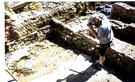
Fotografie vormt een belangrijk onderdeel van de archeologische registratie. Elk spoor wordt afzonderlijk gefotografeerd