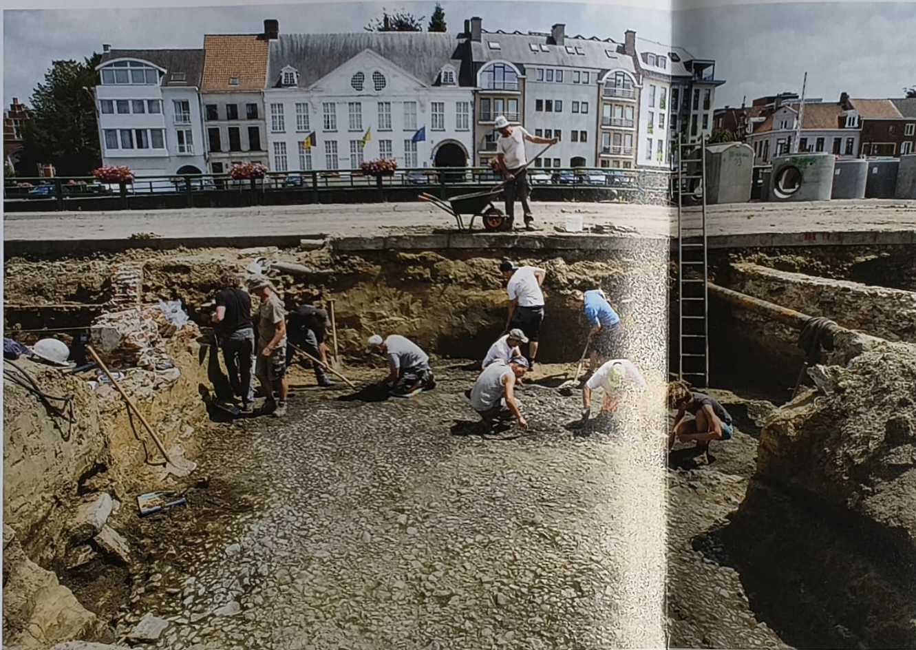
De 12de-eeuwse bestrating van Tussenbruggen bleef uitzonderlijk goed bewaard