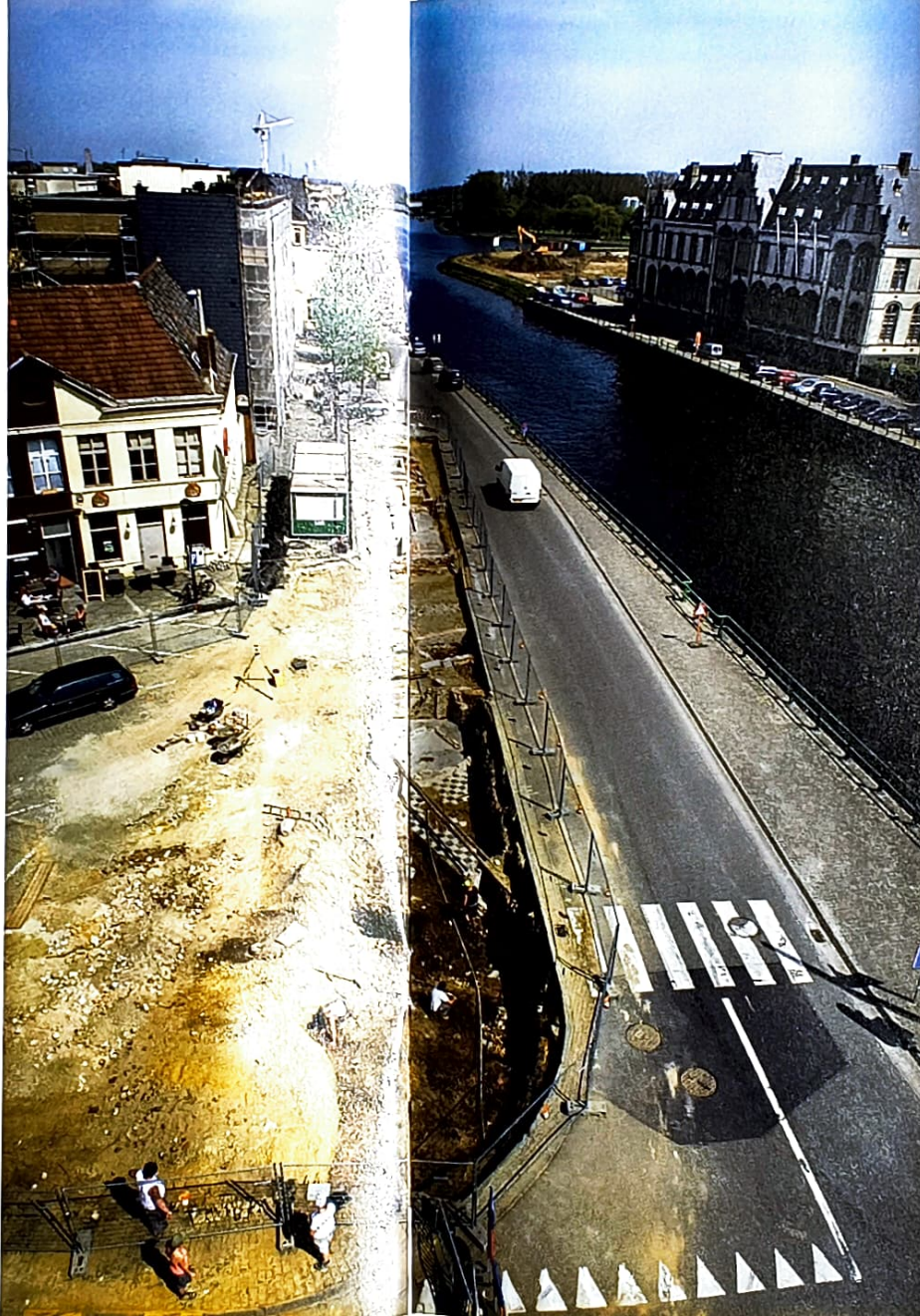
De archeologische opgraving langs Tussenbruggen