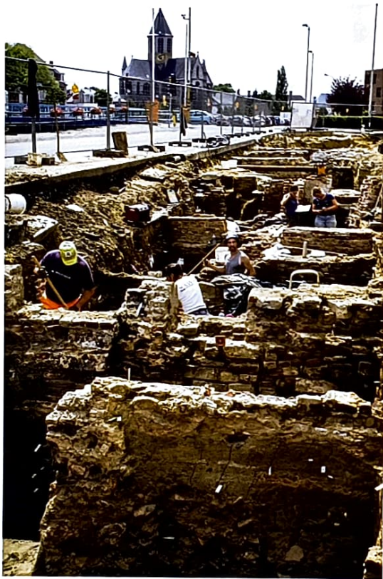
De wirwar van lagen en muren maakt het voor archeologen een uitdaging om het verhaal van de site te begrijpen