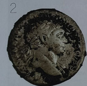
1. In deze ijzeren ring zit een gemsteen vervaardigd met de beeltenis van de god Mercurius. Deze god van de reizigers en handelaars wordt vaak afgebeeld met vleugelletjes, hier ook herkenbaar op de steen. De zak die hij draagt kan mogelijk wijzen op de vele reizigers en handelaars die Velzeke aandedden