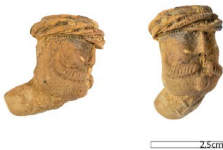
Fig. 2 Laat 17de-eeuwse gezichtspijp met afbeelding van een Ottomaan. Vindplaats Ninove Doorn-Noord.

opkrullende snor en sik komen ook voor bij de Jonaspipen uit de 17de eeuw, de vormgeving is echter anders. Ook de levensechte uitwerking van het gelaat past niet in de Goudse traditie, net als de aanwezigheid van een tulband. Bovendien kijkt de Goudse Jonas altijd de roker in het gezicht. De man met tulband op de pijp uit Ninove, kijkt net weg van de roker.