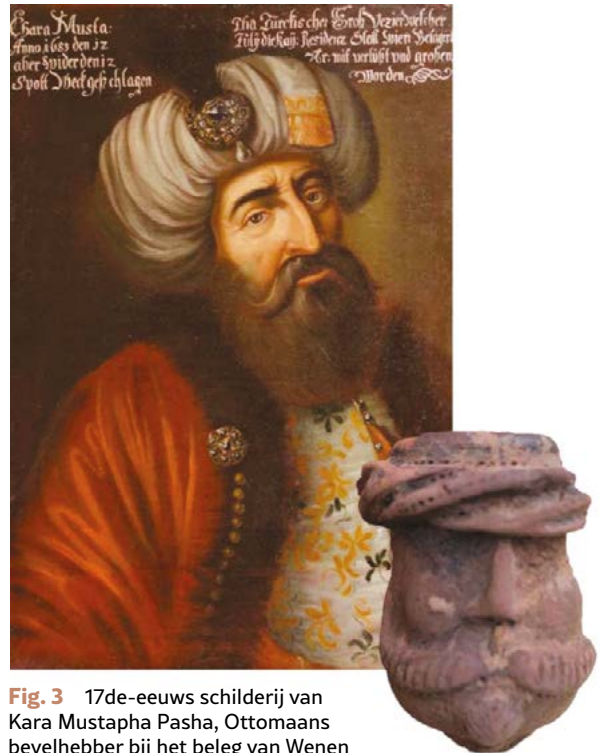
Fig. 3 17de-eeuws schilderij van Kara Mustapha Pasha, Ottomaans bevelhebber bij het beleg van Wenen

Schweiz, in: Keramik Zwischen Werbung, Propaganda und Praktische Gebrauch. Beiträge vom 50. Internationalen Symposium für Keramikforschung in Innsbruck 2017 , Nearchos 23, Innsbruck, p. 185–202.