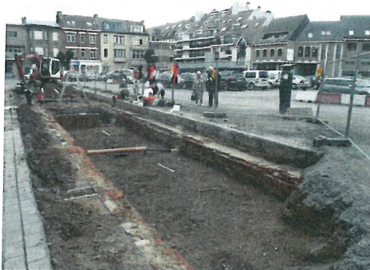
Zicht op de zuidelijke pandgang

Ter hoogte van het westelijke deel van deze sleuf is bovendien een deel van het, na 1797 onderkelderde, woongedeelte van het klooster blootgelegd.