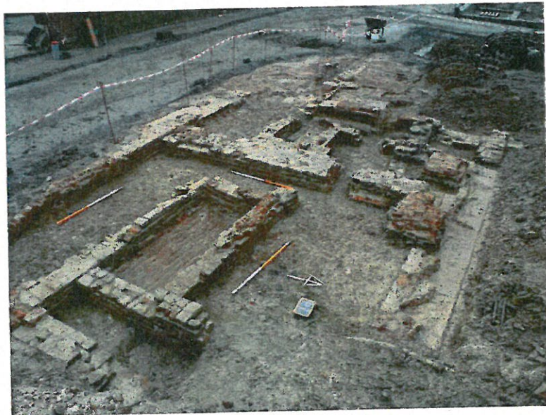
Muurresten naast de toegangspoort van de katuizerprijorij

Een tweede murenconcentratie bevond zich naast de toegangspoort van de katuizersite. Dit opgravingsvlak voor de huidige pastorij bewaarde een groot aantal muurfunderingen waarin zeven fasen zijn herkend. Alle muren zijn gemetst met bakstenen en kalkmortel. Er kon een gebouw, een rioleringsysteem en een beerput worden onderscheiden. Door het ontbreken van vondstenmateriaal en de geringe registratiediepte (-0,40 m onder het huidige loopvlak) blijven een aantal onderzoeksvragen onbeantwoord. De datering kon niet worden vastgesteld door de geringe registratiediepte, afwezigheid van vondsten en historische/cartografische bronnen. Doordat deze bebouwing niet te zien is op het plan van 1784, kan men enkel met zekerheid stellen dat deze bebouwing dateert vóór 1784.