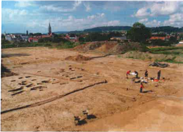
Fig. 2: Noordoostelijke hoek van de nederzetting met het stadscentrum op de achtergrond.

De vondsten tonen aan dat het ontstaan van de site zich op het scharnierpunt van de vroege met de volle middeleeuwen bevindt. Het aardewerk bestaat voornamelijk uit kogelpotten in handgevormde waar die enerzijds in Karolingische en anderzijds in volmiddeleeuwse traditie zijn vervaardigd. In de loop van de 10de en 11de eeuw verschijnen importen van handgevoerd aardewerk met een donkere kern, roodbeschilderde waar uit het Rijnland en aardewerk uit de Maasstreek. De vondsten en de weinige oversnijdingen van de sporen onderling verraden een relatief korte levensduur van de nederzetting. Toch is een zekere fasering voorop te stellen. De oprichting van de site vond vermoedelijk plaats op het einde van de 9de of het begin van de 10de eeuw. Uit deze periode dateren enkele omvangrijke uitgravingen in de zuidelijke sector die getuigen van een vorm van waterwinning en/of leemontginning. Het graven van de afbakenende gracht voltrok zich waarschijnlijk in dezelfde periode (de demping ervan situeert zich in de 10de en de 11de eeuw). Het westelijke en zuidelijke gebouw plaatsen we op het einde van de 9de tot de 10de eeuw. Het noordelijke gebouw is mogelijk iets jonger: de 10de of de eerste helft van de 11de eeuw. Wanneer de nederzetting is opgegeven, kunnen we voorlopig niet nader bepalen dan ten vroegste op het einde van de 10de, maar vermoedelijk eerder in de eerste helft van de 11de eeuw.