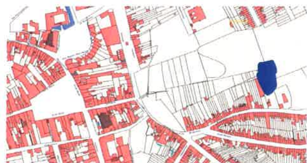
Fig. 3: Situering van de nederzetting t.o.v. het stadscentrum.

Een opmerkelijke vaststelling is de aanwezigheid van een aantal lineaire sporen die de volmiddeleeuwse site doorkruisen (fig. 1). Deze tracés tonen zich in doorsnede als 'holle wegen' die verschillende fases kenden. Het sterk gevarieerde materiaal weerspiegelt een langdurig gebruik ervan gedurende de late- en post-middeleeuwen. Ze bleven tot op heden in het landschap bewaard als voetwegels die aansloten op de huidige straten rond de site. Dat deze tracés zich net ter hoogte van de voormalige toegangen van de volmiddeleeuwse nederzetting bevinden, is geen toeval. Gedurende het bestaan van de nederzetting ontstonden waarschijnlijk kleine wegels die leidden naar de toegangen, hoewel deze archeologisch niet meer vast te stellen waren. We mogen er van uitgaan dat, na het verdwijnen van de bewoning, de toegangswegen in gebruik zijn gebleven in de vorm van holle wegen, en dat deze op hun beurt opgevolgd zijn door de huidige voetwegels. We kunnen bijgevolg een continuïteit vooropstellen van ongeveer 11 eeuwen!