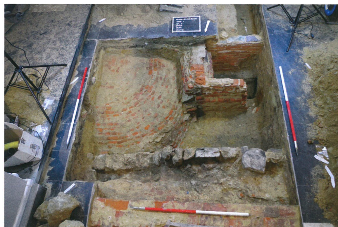
Fig. 4: Overzicht vanuit noordwestelijke hoek op de overwelfde grafkelder

Het aantreffen van begravingen binnen een kerk, hoeft vanzelfsprekend niet te verbazen. Toch zorgde de aanwezigheid van een grote grafkelder ter hoogte van het koor voor een verrassing. Deze grafkelder behoorde toe aan Lucas Cayro, heer van Moorsel in de 17de eeuw, en zijn naaste familie. In de 19de eeuw, tijdens het vernieuwen van de kerkvloer, werd deze grafkelder 'herontdekt' en zijn de beenderen van de overledenen verzameld en elders in de kerk opnieuw begraven. Hierbij is men niet bepaald voorzichtig te werk gegaan, waardoor de tombe een sterk geplunderde aanblik vertoonde. De grafkelder meet ongeveer 4,5 bij 2,2 m, heeft een zuidwest-noordoost oriëntatie en is opgedeeld in twee ruimtes, oorspronkelijk gescheiden door een volle muur in baksteen. Er is zowel een ingang aan zuidwestelijke als aan noordoostelijke zijde. De meest zuidwestelijk gelegen ruimte (2,2 bij 2 m) was voorzien van een kruisgewelf, een vloer in baksteen, bepleisterde wanden met twee wandtegels met inscripties ('Obyt D. Lucas Cayro, 24 Aprilis 1642' en 'Obyt D Florentia Vander Gracht, Die 15 Ocbris 1660') en een toegang met enkele hoge traptreden. De tweede ruimte vertoonde geen bepleistering, had een eenvoudig tongewelf en was niet voorzien van een vaste vloer. Er zijn geen aanwijzingen dat deze ruimte gebruikt werd om menselijke resten op te stellen. Het noordoostelijke uiteinde van deze ruimte gaf uit op een haaks gelegen 'toegang' die uitgaat onder het altaar van de kerk.