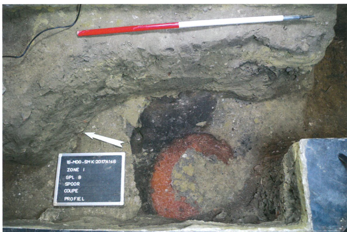
Fig. 3: De klooven zoals deze aanvankelijk tevoorschijn kwam

Aan zuidoostelijke zijde van deze muur werd een gedeelte van een trede en de fundering van een andere trede aangetroffen (Fig. 2, nr. 3). Het lijkt erop dat hier een trap gestaan heeft die afdaalde in zuidoostelijke richting. Gezien de beperkte oppervlakte van de werkputten en -sleuven, blijft het onduidelijk wat het verdere tracé van de aangetroffen muren is en kan voorlopig niet met zekerheid vastgesteld worden welke muur- en vloerresten tot eenzelfde bouwfase te rekenen zijn. Radiokoolstofdateringen aangevuld met mortelanalyses kunnen hier hopelijk meer duidelijkheid in scheppen.