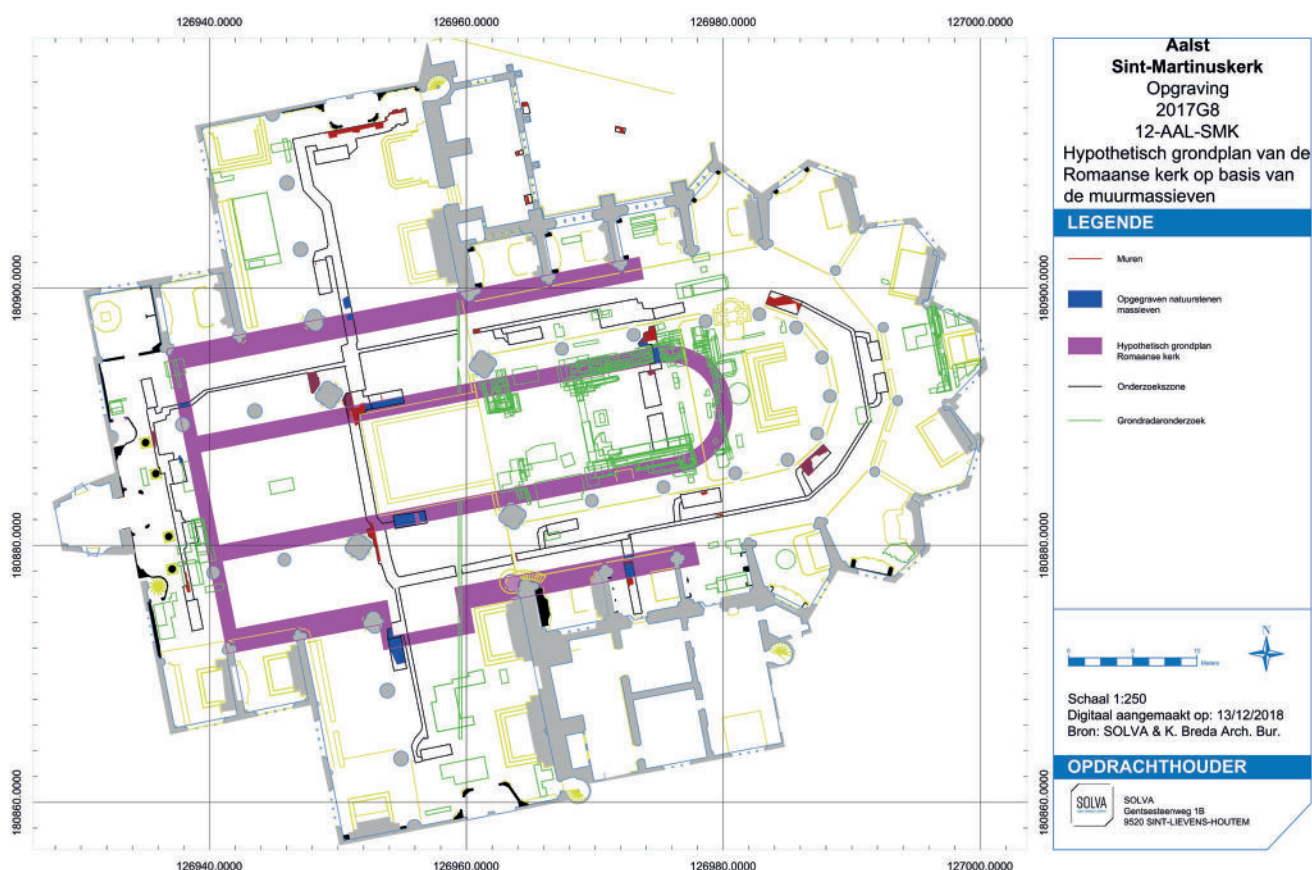
Fig. 3: Hypothetisch grondplan van de Romaanse kerk op basis van de aangetroffen muurmassieven en projectie van het grondradaronderzoek.

Ter hoogte van de viering, waar het mogelijk was dieper te graven, bevinden zich enkele oudere kuilen die, op basis van 14 C-dateringen, uit de Karolingische periode (tussen 700/750 en 900 n. Chr.) dateren. Dit zijn de oudste dateringen tot op heden binnen de kerk. Hoewel niet met zekerheid kan aangetoond worden dat de aangetroffen sporen in relatie