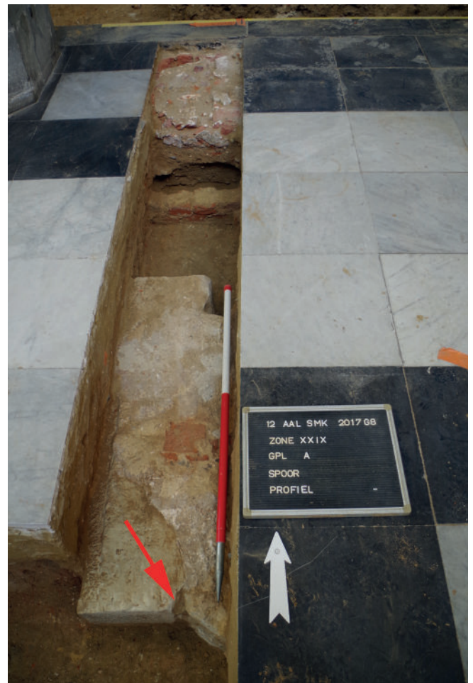
Fig. 2: Het muurmassief in Ledesteen aan noordelijke zijde van het priesterkoor, met aanduiding van de vermoedde aanzet van de koorsluiting.

Op verschillende plaatsen kwamen muurresten aan het licht die behoren tot een voorloper van de huidige kerk.