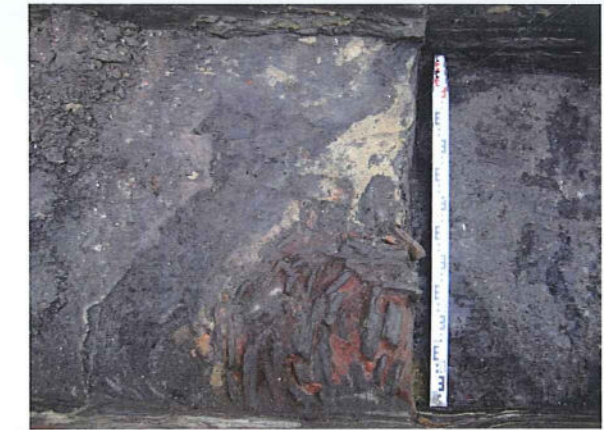
Fig. 1: Haard, opgebouwd uit tegels, aangetroffen bij het proefonderzoek op de hoek van de Zwaanstraat en de Putstraat in Torhout.

In 2009 startten grootschalige infrastructuurwerken op de Graanmarkt en in de aanpalende straten. Het plaatsen van nieuwe rioleringen ging gepaard met de heraanleg van allerlei nutsleidingen en vormde voor de stad Ninove meteen ook de gelegenheid om over te gaan tot een globale herinrichting en opwaardering van de Graanmarkt. Voorafgaand aan de werken werd daarom de westelijke helft van de Graanmarkt geëvalueerd met proefsleuven. De oostelijke helft van de Graanmarkt (de voormalige Varkensmarkt) werd niet aan een archeologisch vooronderzoek onderworpen aangezien eerdere infrastructuurwerken (collector