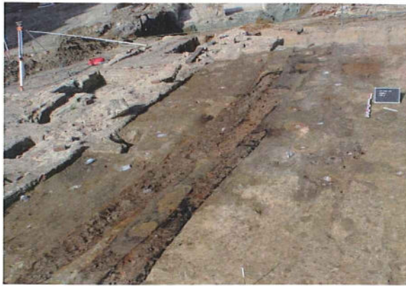
Fig. 2: In situ-verbrande en houtskoolrijke langwerpige "kuilen" of greppels.

een munt in het noordelijke deel. De bouw van het poortgebouw zou tussen 1556 en 1662 moeten gesitueerd worden.