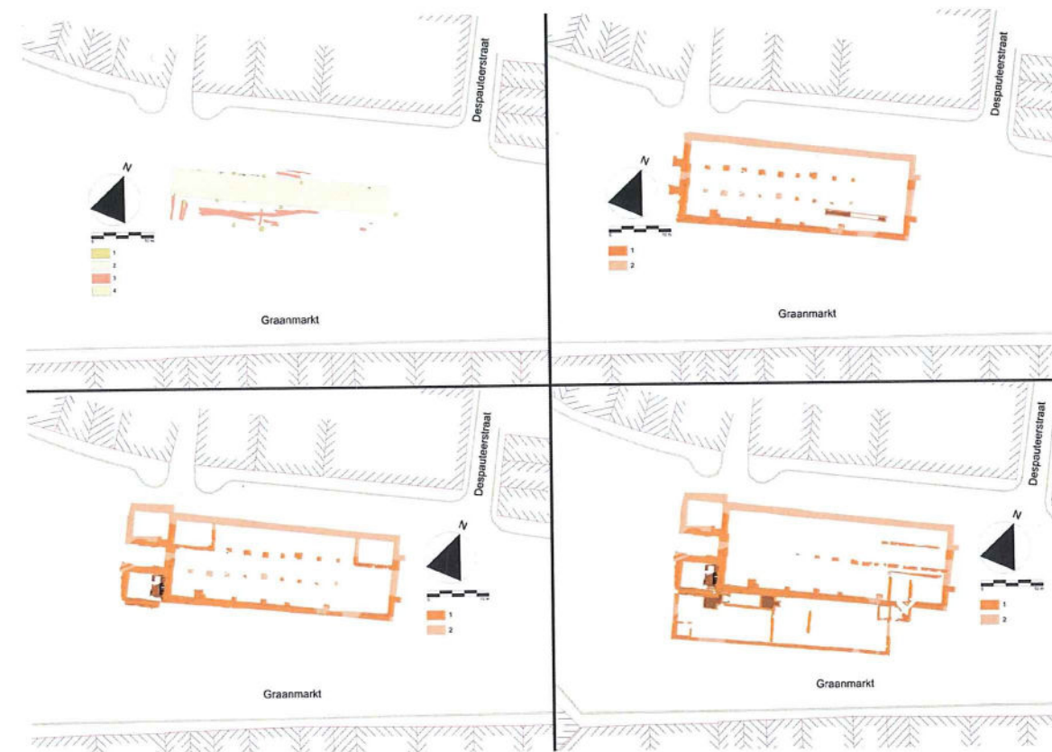
Fig. 1: Fasering van de graanhal: Fase 1: (1) poeren, (2) zandige vulling van de weg, (3) verbrande langwerpige kuilen, (4) restanten van bestrating; Fase 2: (1) constructieresten, (2) reconstructie; Fase 3: (1) constructieresten, (2) reconstructie; Fase 4: (1) constructieresten, (2) reconstructie.

lemen vloeren en de puinlagen met verbrande daktegels binnen de vleugels tonen duidelijk aan dat het gebouw verschillende malen moet afgebrand zijn. Niet alle brandsporen kunnen hier evenwel aan toegeschreven worden. Opmerkelijk is de aanwezigheid van in situ -verbrande en houtskoolrijke langwerpige “kuilen” of greppels. Mogelijk zijn deze in verband te brengen met het stoken van hout om het opgeslagen graan te drogen of droog te houden. Hoe lang deze houten versie van de graanhal bestaan heeft, kon op basis van het onderzoek niet precies bepaald worden, al is dit zeker tot na 1420.