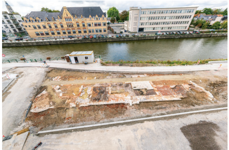
Fig. 1. Luchtfoto van de opgraving.

Het terreinonderzoek bestond uit een werfbegeleiding van de heraanleg van de parking, waarbij het archeologische onderzoek zich beperkte tot een vlakregistratie van het kasteel (fig. 1). Dit impliceerde dat er geen coupes of dwarsdoorsnedes konden gemaakt worden, wat een impact had op de mogelijkheid om de verschillende bouwfases te dateren. Het kasteel is immers een palimpsest met een gebruiksgeschiedenis van meer dan 500 jaar (fig. 2).