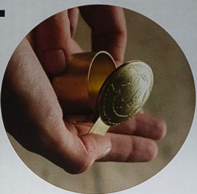
Het eindresultaat van de reconstructie