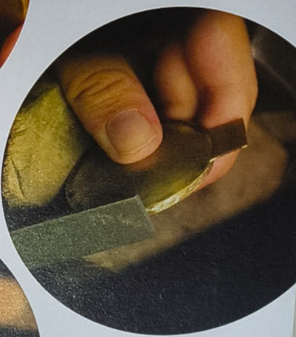
De verschillende stadia van het productieproces productieproces