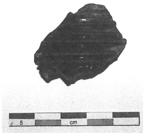
Fig. 3 : glasfragment met metaaldraadversiering (proefsleuf 29, spoor 7)