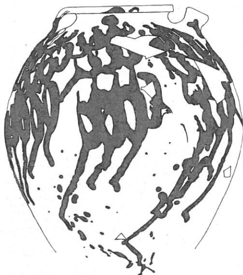
Fig. 2 : recipiënt in roodbeschilderd aarde werk (proefsleuf 29, spoor 7)

In december 2007 werd een kleiner opgravingsvlak van ca 3000 m 2 aangelegd, ongeveer 400 meter ten zuiden van de bovengenoemde site (Fig. 1-3). Op dit perceel werden in de proefsleuven reeds kogelpotfragmenten uit de Karolingische periode (9 de eeuw) gevonden. Bij afgraving bleek ook hier een gebouwplattegrond en minstens twee spiekertjes onderscheidbaar. Het areaal rond deze structuren werd omgeven door een reeks onderbroken grachten, waarvan de oriëntatie nog steeds door de huidige perceelsgrenzen gerespecteerd wordt. De Karolingische site, gelegen aan de rand van een kouter aan de samenvloeiing van de twee begrenzende beken, wordt aan de westzijde geflankeerd door een bestaande veldweg die het achterliggende koutergebied centraal doorloopt. Een coupe op deze veldweg leverde karrensporen op. Deze elementen lijken duidelijk met elkaar in relatie te staan.